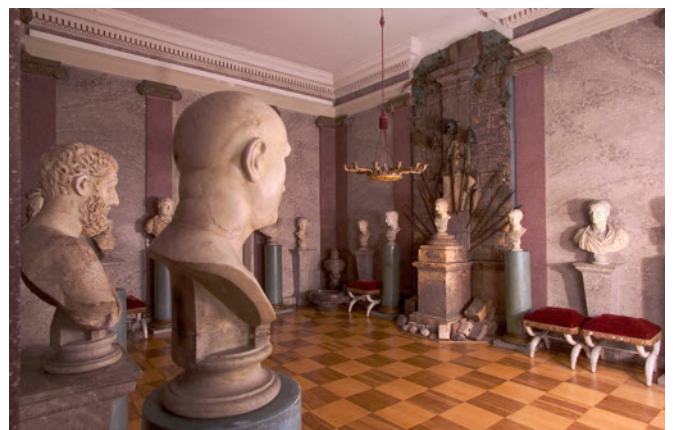
Blick in eines der Römischen Zimmer (Audienzraum) im Erbacher Schloss mit den Büsten antiker Kaiser. Auch Porträts von Herrschern der julisch-claudischen Dynastie sind darunter.

Wir wünschen Ihnen einen angenehmen Aufenthalt - vom Fischbachtal aus ist Erbach leicht mit dem PKW zu erreichen.